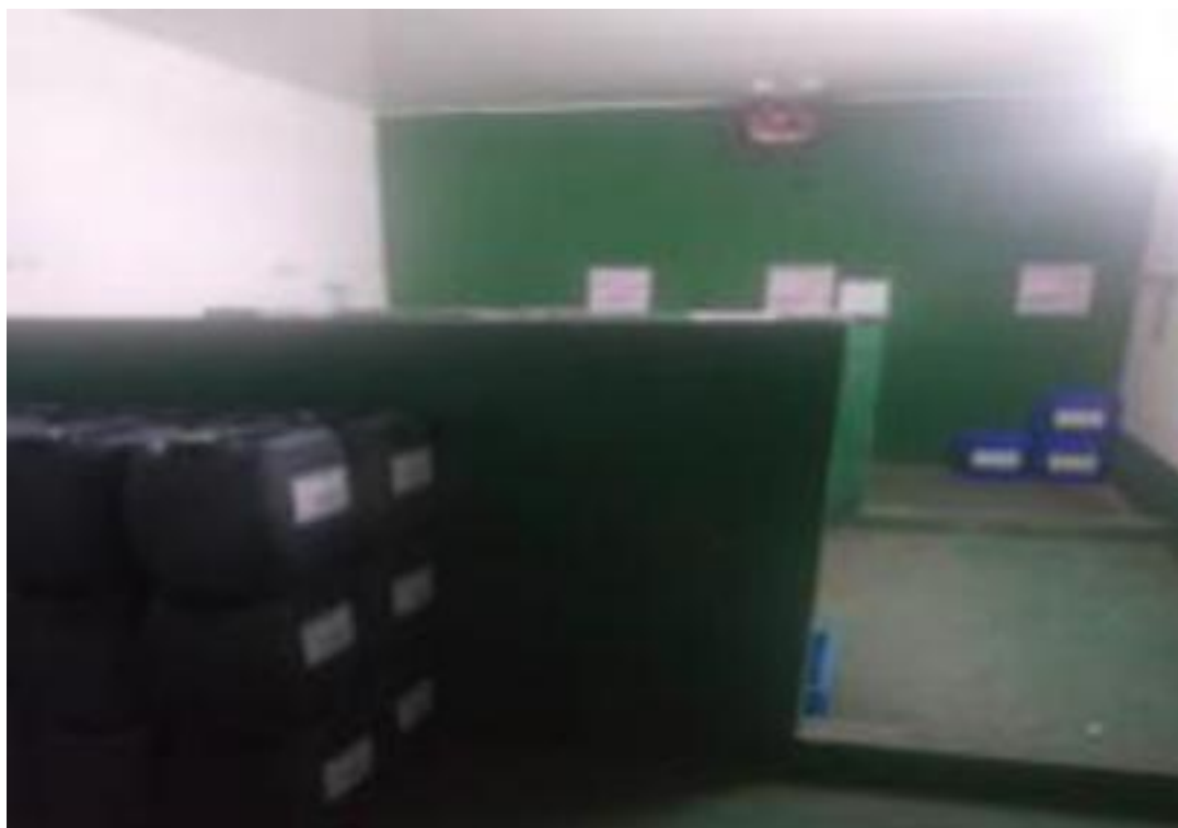
化学品仓库设置了环氧地坪及围堰，并有明显间隔