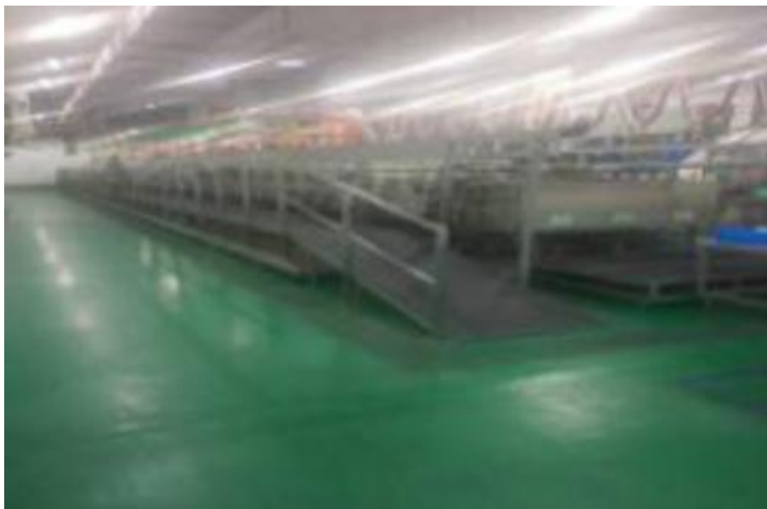
生产车间设置环氧地坪，定期检查