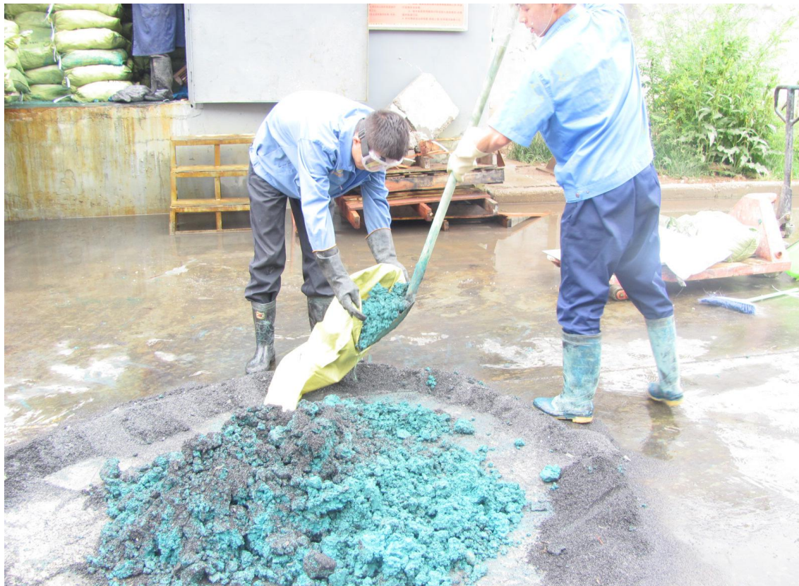
应急预案演练现场照片4