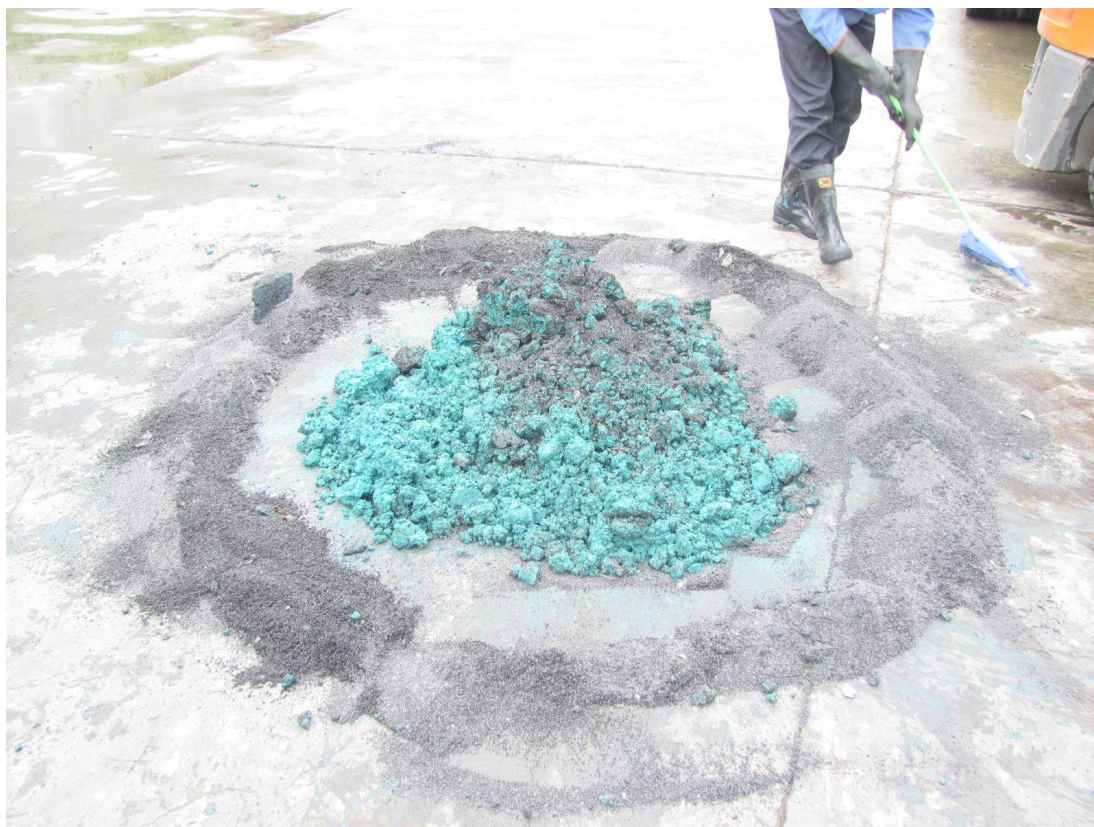
应急预案演练现场照片3