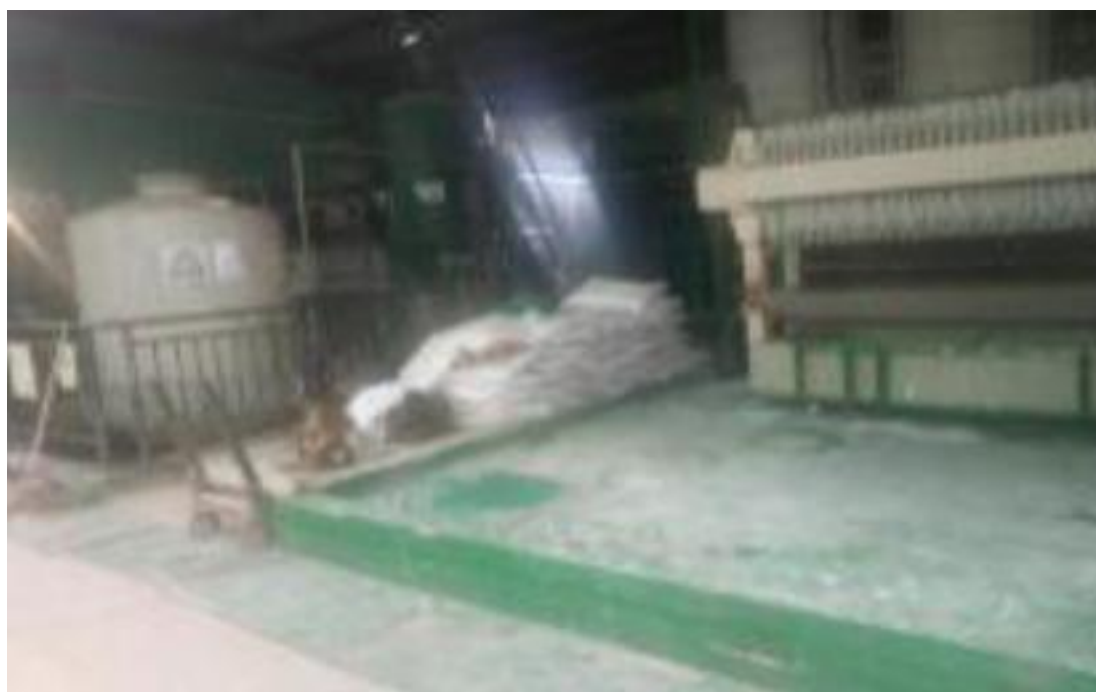
污水处理站设置环氧地坪并定期检查，设置了防渗漏围堰