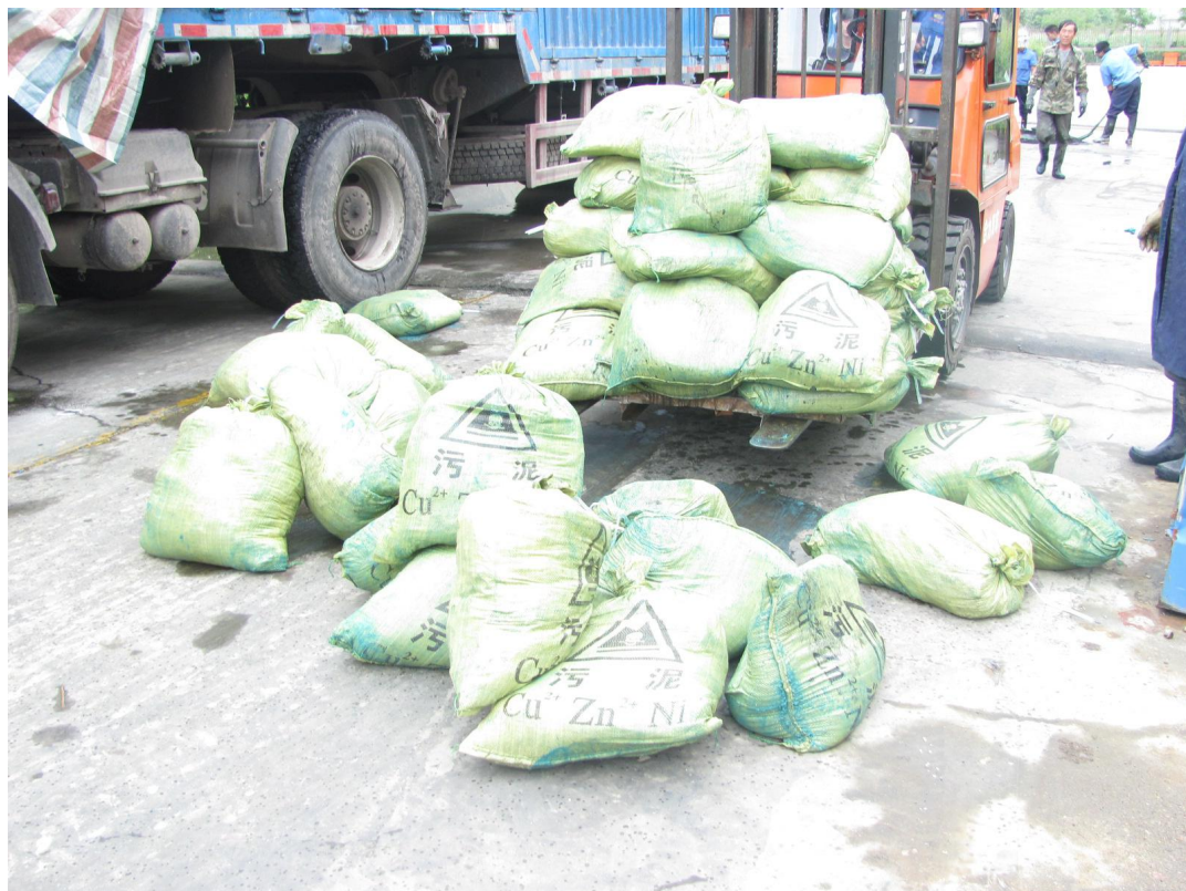
应急预案演练现场照片1