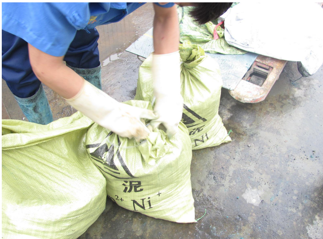
应急预案演练现场照片5