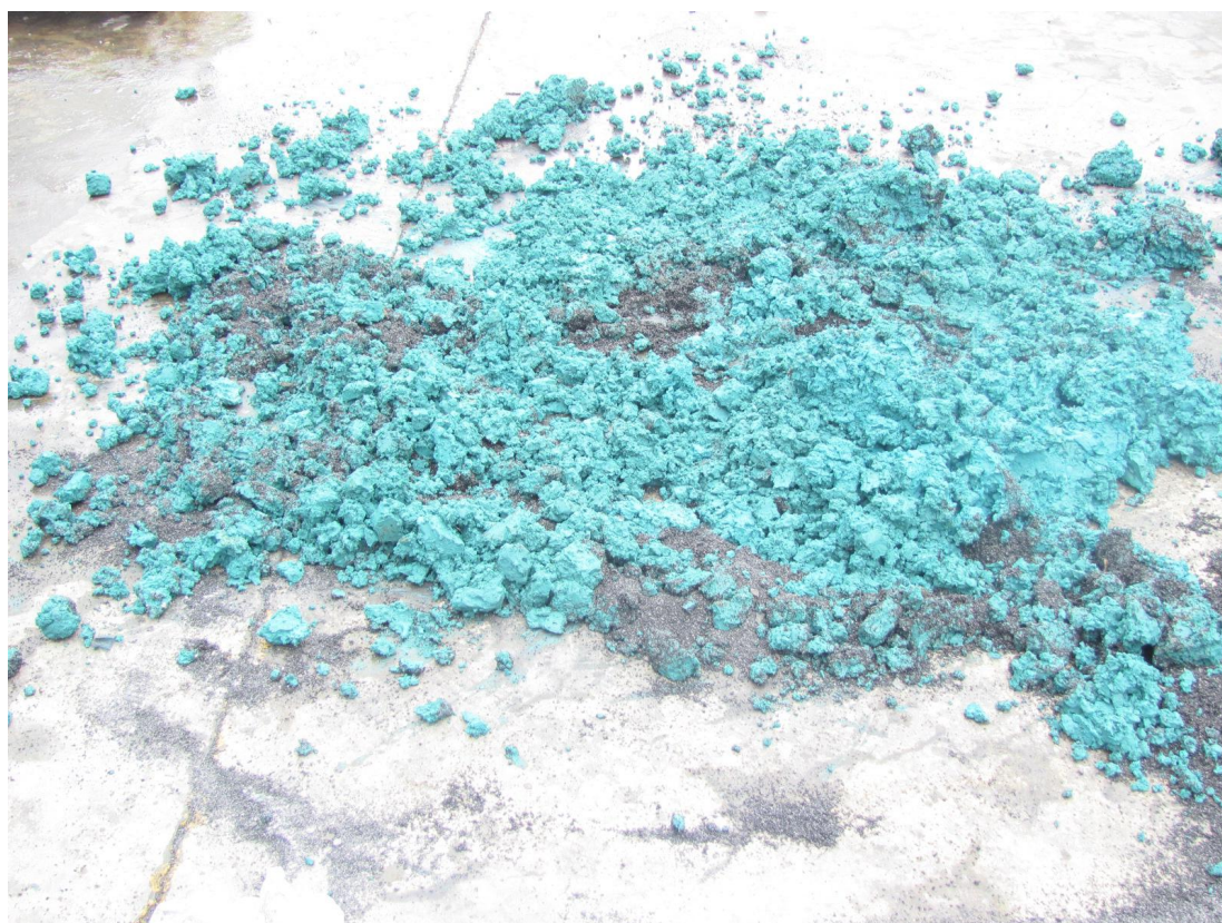
应急预案演练现场照片2（污泥的泄露）