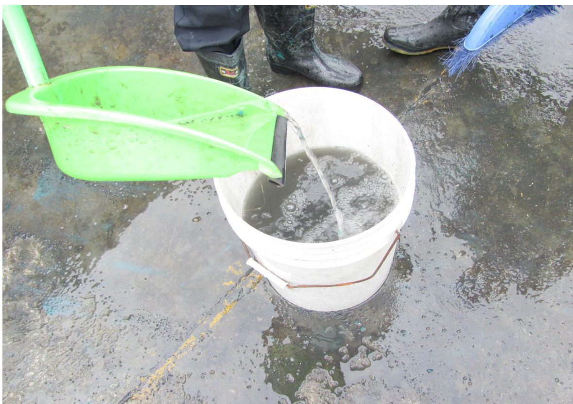
应急预案演练现场照片6