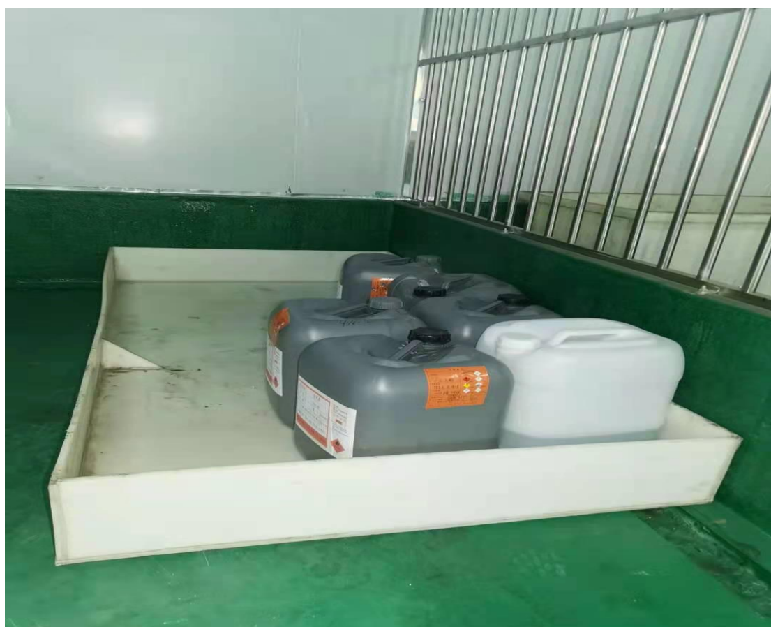
危废仓库设置了环氧地坪，设置防渗漏托盘